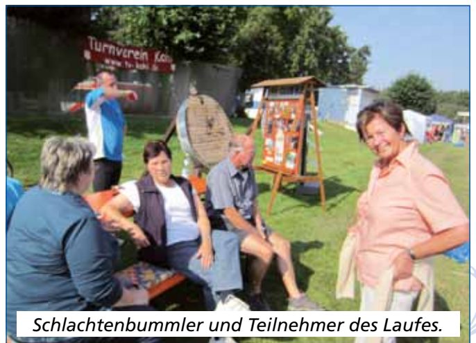
Schlachtenbummler und Teilnehmer des Laufes.