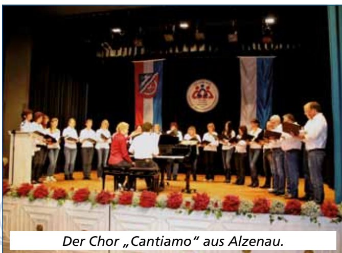
Der Chor „Cantiamo“ aus Alzenau.